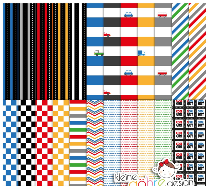
digitale Papiere "Tut Tut Streifen & Co"