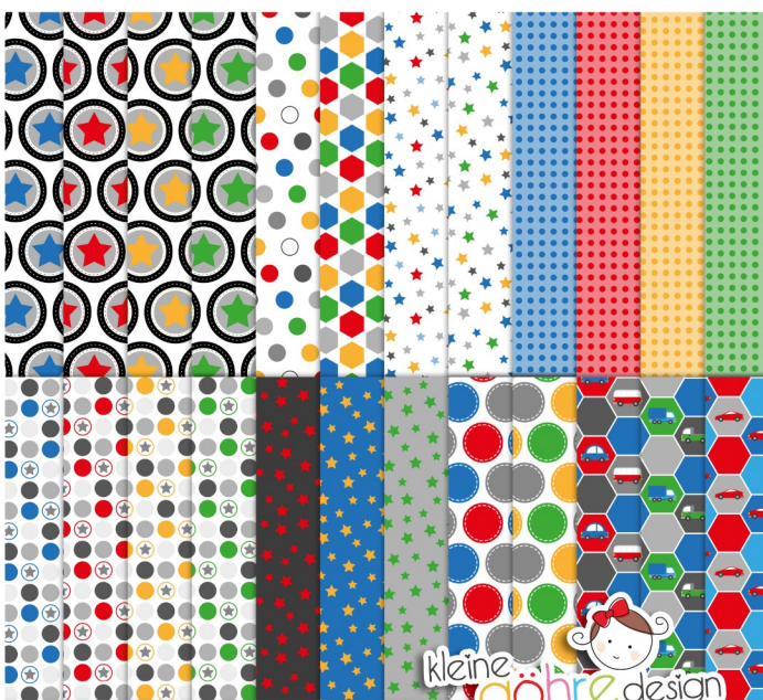
digitale Papiere "Tut Tut Punkte & Co"